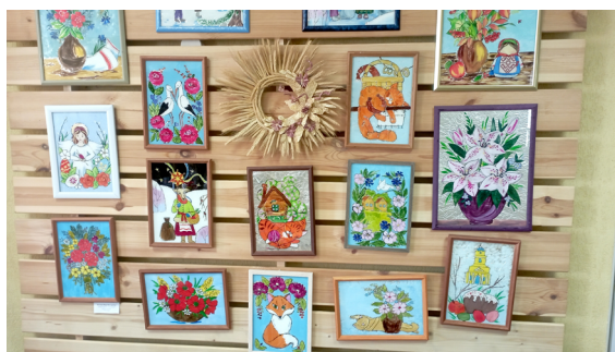
Рис. 6. Работы учащихся образцовой студии декоративно-прикладного искусства «Шклинка-маляванка» Пружанского районного центра культуры, 14 мая 2025 г.

Склетипическое отношение к выставочной деятельности у многих мастеров связано с тем, что районные власти редко выделяют транспорт, на котором мастерам можно было бы добраться до места проведения выставки и доставить туда свои работы: «Если о наболевшем. Вот, прямо сейчас будет "Вясновы букет". Мы едем туда за свои деньги. Нам нету ни стола, ничего. Нам это тяжело приехать и везти оборудование. При этом нужно заплатить 60 рублей взнос. Как бы не так уж много этих мастеров, которые занимаются традиционными видами, чтобы еще с них это... Это государство могло бы взять на содержание союза. Не с самих мастеров, а для мастеров» 1 .