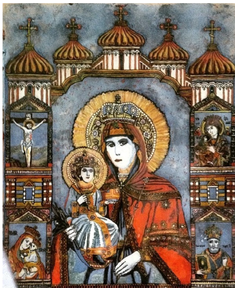
Рис. 4. Икона Богоматери Иерусалимской (авт. Василевская Елена Моисеевна, д. Здитово Березовского района Брестской области, 1950–1960-е гг.)

Кроме произведений декоративного характера, которые доминировали в 1950-е гг., отдельные мастера, преимущественно в Березовском районе, создавали в этой технике и иконы: «Это были домашние иконы. Они не были для того, чтобы в костёле или в церкви. Это были домашние иконы-обереги» 3 (рис. 4).