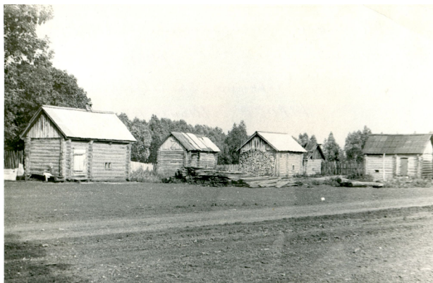
Рис. 1. Типичное расположение бань напротив усадеб через улицу в д. Егоркино Октябрьского р. ТАССР. Июнь 1984 г. Отд. VIII. Ед. хр. 861, инв. № 7743 [10]

Бани по-черному изначально строились, как правило, вне дворов, на отдалении, чтобы снизить риск от возможного пожара. Их ставили напротив домов, образуя как бы вторую (противоположную) линию улицы (рис. 1). Еще один вариант – у воды (у оврага) (рис. 2). Бани по-белому, которые появились значительно позже курных, были менее пожароопасными, поэтому их стали интегрировать в дворовые строения.