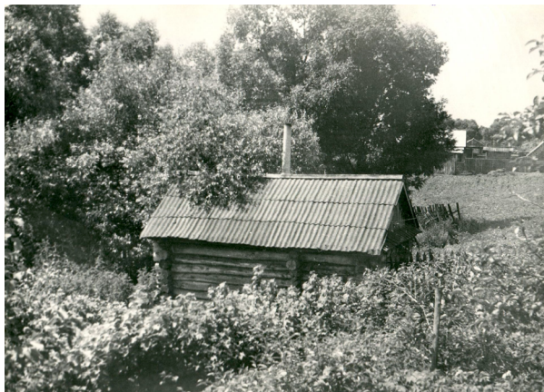
Рис. 2. Традиционное расположение бани в конце огорода у оврага. Алькеевский р. ТАССР. 1976 г. Фото Е. С. Сидоровой // ЧГИГН: Отд. VIII. Ед. хр. 601, инв. № 3990 [11]

Локация обряда «Девичьей бани» имеет совершенно прозрачные коннотации: