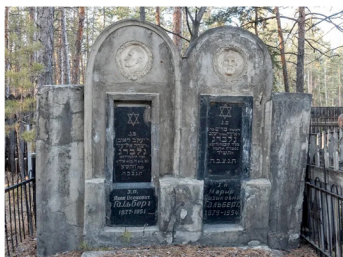
Рисунок. Надгробие над двойным захоронением супругов Я. И. и М. А. Гальбергов. 1955 г. Песчаник. Высота – 180 см Рис. Е. Г. Павловой

Осмотр сохранившихся надгробий конца XIX – середины XX в. показал их значительное различие друг от друга по стилистике и материалам. Это свидетельствует о заказе памятников родственниками умерших в разных мастерских как в самом городе, так и за его пределами. Надгробия также были изго-