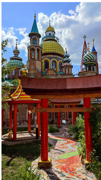
Рис. 3. Внутренний дворик Храма всех религий