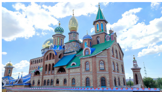
Рис. 2. Вид со стороны железной дороги на Храм всех религий